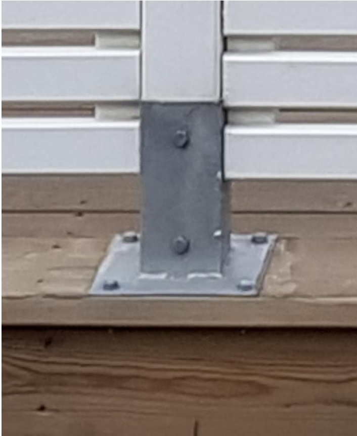
Exempel på infästning i altanen med stolpfäste.